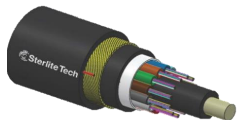
Příklad struktury kabelu (48 vl. 4x12)