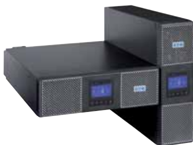
Universální provedení Rack/tower