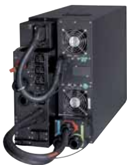
UPS 9PX 11kVA s udržbovým bypassem